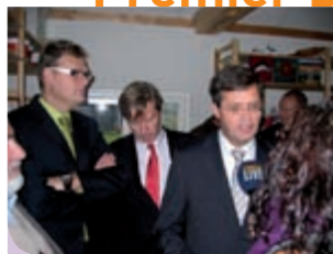
Premier Balkenende midden in de belangstelling tijdens zijn bezoek aan Zorgboerderij de Wielewaal in Venlo.

PROTEION THUIS - Op 5 november jl. kreeg Zorgboerderij en Pluktuin 'de Wielewaal' hoog bezoek. Niemand minder dan premier Balkenende bezocht op deze dag de Venlose zorgboerderij.